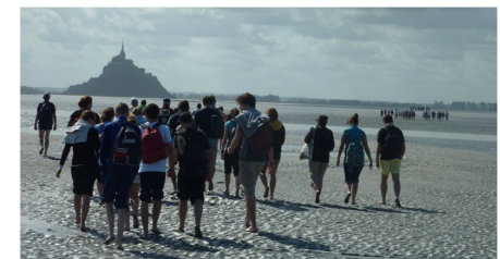
Journée d'intégration au Mont-Saint-Michel

... des visites d'écoles de commerce, des conférences et des sorties extrascolaires (visites de musées, cinéma, théâtre, activités sportives ou culturelles).