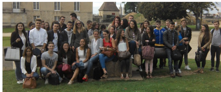
Etudiants de 1ère et de 2ème année (promotions 2015 et 2016)

Spécificité de la classe préparatoire : un accompagnement personnalisé grâce au système de « colles ». Ces interrogations orales, dispensées par des professeurs de la classe préparatoire, de lycée, de BTS, ou d'IUT, s'effectuent individuellement ou par groupe de trois étudiants.