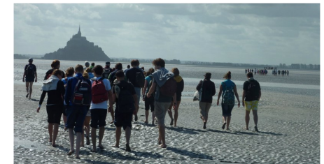
Journée d'intégration au Mont-Saint-Michel

... des visites d'écoles de commerce, des conférences et des sorties extrascolaires (visites de musées, cinéma, théâtre, activités sportives ou culturelles).