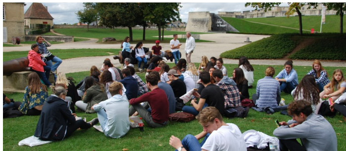
Quelques étudiants de 1ère et de 2ème année

Spécificité de la classe préparatoire : un accompagnement personnalisé grâce au système de « colles ». Ces interrogations orales, dispensées par des professeurs de la classe préparatoire, de lycée, de BTS, ou d'IUT, s'effectuent individuellement ou par groupe de trois étudiants.