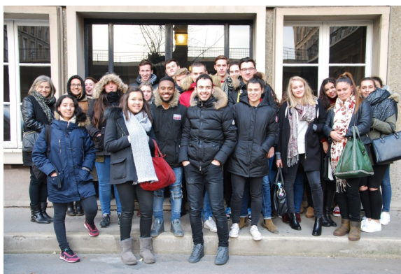
Quelques étudiants lors d'une sortie au Havre

Spécificité de la classe préparatoire : un accompagnement personnalisé grâce au système de « colles ». Ces interrogations orales, dispensées par des professeurs de la classe préparatoire, de lycée, de BTS, ou d'IUT, s'effectuent individuellement ou par groupe de trois étudiants.