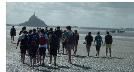
Journée au Mont-Saint-Michel

... des visites d'écoles de commerce, des conférences et des sorties extrascolaires (visites de musées, cinéma, théâtre, activités sportives ou culturelles).