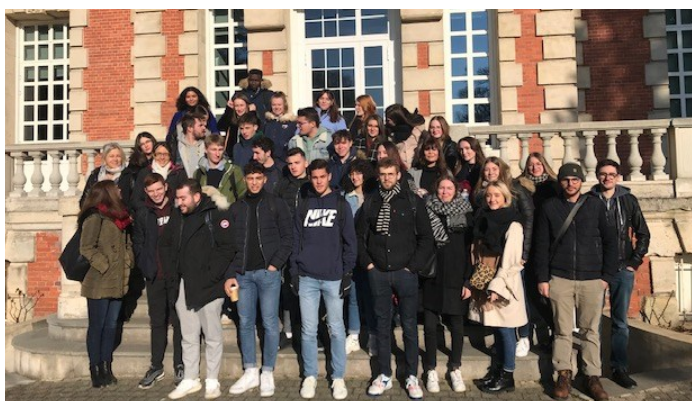
Visite de NEOMA Rouen

Spécificité de la classe préparatoire : un accompagnement personnalisé grâce au système de « colles ». Ces interrogations orales, dispensées par des professeurs de la classe préparatoire, de lycée, de BTS ou d'université, s'effectuent individuellement ou par groupe de trois étudiants.