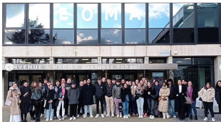
Visite de NEOMA Rouen (2023)

Spécificité de la classe préparatoire : un accompagnement personnalisé grâce au système de « colles ». Ces séances d'entraînement, dispensées par des professeurs de la classe préparatoire, de lycée, de BTS ou d'université, s'effectuent individuellement ou par groupe de trois étudiants.