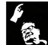
Lycée Salvador Allende HEROUVILLE ST CLAIR