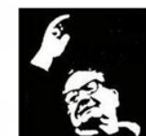
Lycée Salvador Allende HEROUVILLE ST CLAIR